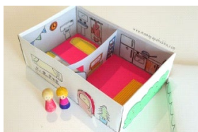
UPCYCLED shoebbox dollhouse